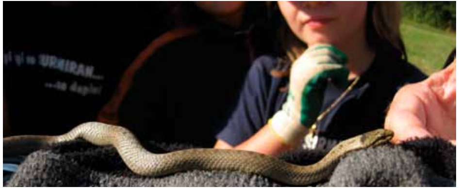
Harmlos: Eine Schlingnatter vor den neugierigen Schülerinnen und Schülern.

Die Gemeinden im Surses haben sich entschlossen, beim Gütelabel für eine nachhaltige Energiepolitik von Städten und Gemeinden mitzuwirken. In diesem Oktober finden erste Aktivitäten mit Gemeindevertretern statt.