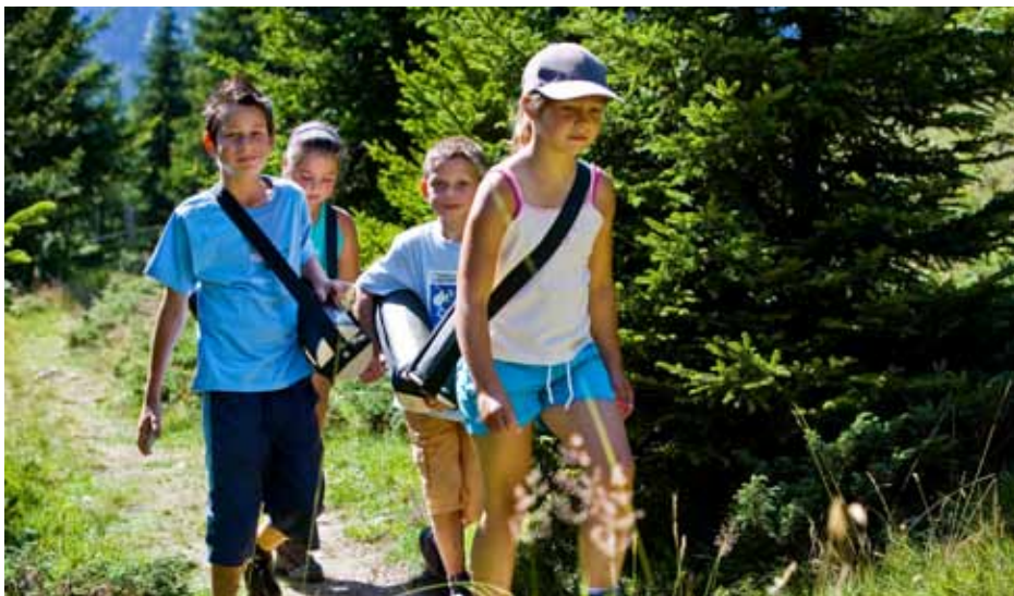
Mal Wissenschaftler spielen und viel über die Natur lernen: Kinder mit dem Forscherkit unterwegs auf dem Forscherparcours auf der Alp Flix.

70 Teilnehmer begaben sich am 23. Juli bei schönem Wetter in Savognin auf eine kulinarische Rundwanderung. An sechs Stationen machten sie halt und genossen Spezialitäten aus dem Parc Ela: Käse, Getränke, Fleisch, Süssigkeiten. Die Senda culinaria stiess auf Begeisterung, und die Teilnehmenden wünschten sich für nächstes Jahr eine Wiederholung. Der Parc Ela hatte den Anlass in Zusammenarbeit mit alpina-vera organisiert, der Vermarktungsorganisation für Produkte aus den Berggebieten.