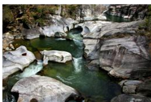
Marmitte dei giganti