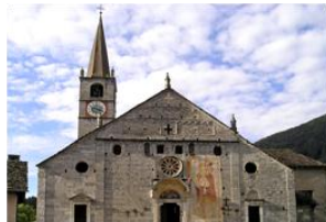
Chiesa di San Gaudenzio a Baceno