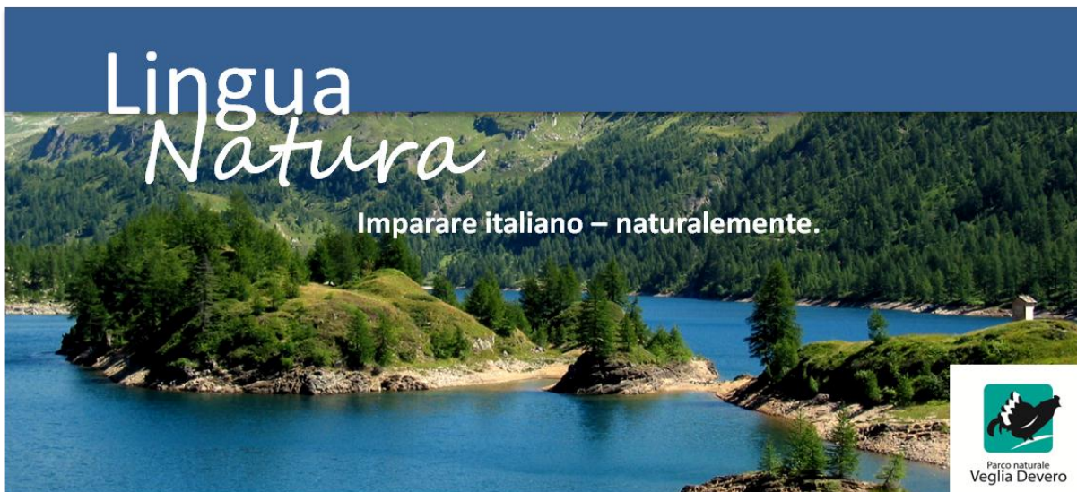
Lago di Devero, 1850 m