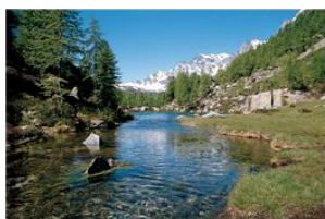
Lago delle Streghe 1760 m