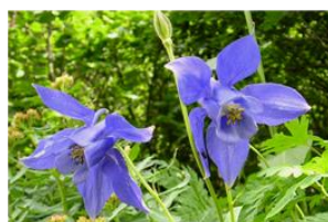
Aquilegia alpina, una rarità del Parco