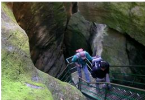
Gli Orridi di Uriezzo