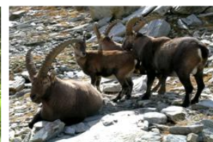
Gruppo di stambecchi del Parco

Il Parco Naturale Alpe Veglia e Alpe Devero, situato nell'estremo nord del Piemonte, è stato il primo dei parchi regionali ad essere istituito, nel 1978. Confina a nord est con il Parco Paesaggistico della Valle di Binn (Landschaftspark Binntal) in Svizzera a cui è storicamente unito attraverso la Bocchetta d'Arbola (Albrunpass), antica via commerciale.