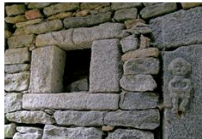
Decorazione scolpita in Cuggina