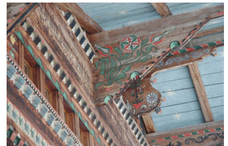
Maison paysanne au Diemtigtal (BE)

Une place de stage est aujourd'hui disponible au Réseau (début en juillet ou à convenir). Renseignements auprès d'Andreas Weissen.