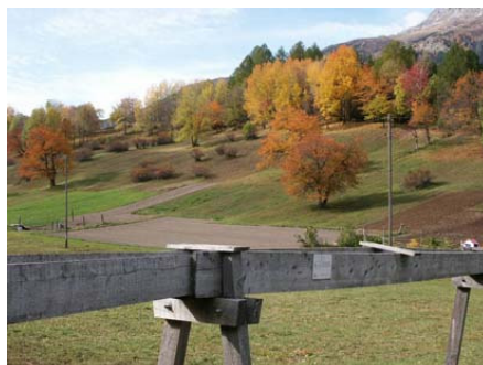
Ambiance automnale à Ernen dans le Binntal

Et, en effet, cela a été un franc succès pour Suisse Tourisme ! Le thème des « Parcs » plaît tout particulièrement aux journalistes. C'était d'ailleurs la présentation aux médias internationaux la plus fréquentée de Suisse Tourisme durant les dix dernières années.