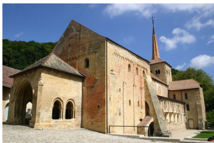
Romainmôtier dans le Parc jurassien vaudois.

Et ce n'est pas tout! En effet, nous traiterons également du projet Innotour „Développement des offres touristiques“, des nouveautés au niveau de l'OFEV et discuterons de nos idées pour 2010, année internationale de la biodiversité.