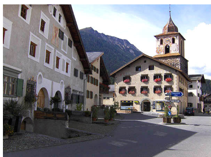
Bergün, au Parc Ela

Le secrétariat du réseau vous remercie de lui envoyer vos exemples et suggestions.