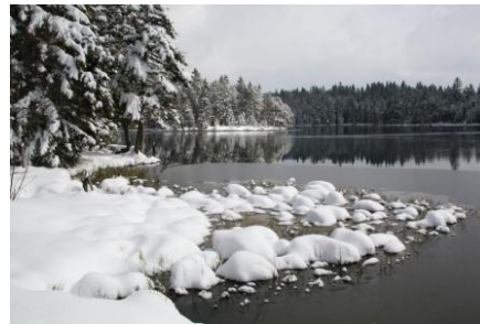
Etang de la Gruère dans le Parc naturel du Doubs

Les quatre parcs apprendront à la fin de l'été s'ils pourront entrer en phase de gestion en janvier 2013.