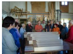
Fabbrica di organi