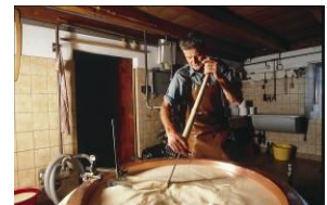
Produzione del „Gruyère d'alpage“

Domenica Viaggio individuale e saluto iniziale 18:00: Arrivo, cena comune, conoscenza dei partecipanti, informazioni sullo svolgimento della settimana