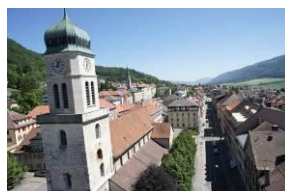
Collegiale di Saint-Imier