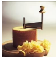
„Tête de moine“