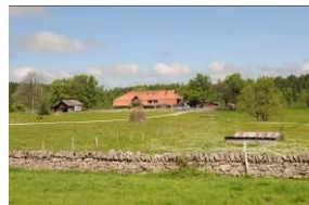
Muro a secco