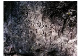
Ponte degli anabattisti

Scoprite con Lingua Natura la varietà naturale, culturale e culinaria del Parc Chasseral!